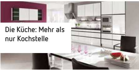
Die Küche: Mehr als nur Kochstelle