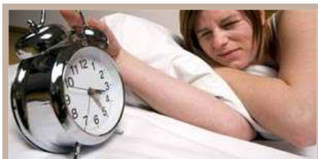
Schlaflose Nächte müssen nicht sein. No-Gos im Schlafzimmer unbedingt vermeiden.

Das Schlafzimmer ist ein ganz besonderer Ort. Hier wird geruht, geträumt, gelacht, gespielt, geliebt, gekuschelt, gelesen oder auch gebetet. An diesem Ort gelten deshalb, zumindest für entspannungsfreudige Menschen, ganz besondere Regeln. Ein Wohnpsychologe und eine Feng Shui-Expertin verraten Ihnen die zehn wichtigsten No-Gos im Schlafzimmer – sowohl nach den allerneuesten, als auch nach uralten gestaltungspsychologischen Erkenntnissen. Und sie geben sieben wirksame Einrichtungstipps für eine entspannte Atmosphäre im