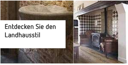
Entdecken Sie den Landhausstil