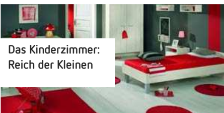
Das Kinderzimmer: Reich der Kleinen