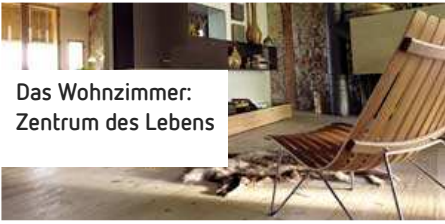
Das Wohnzimmer: Zentrum des Lebens